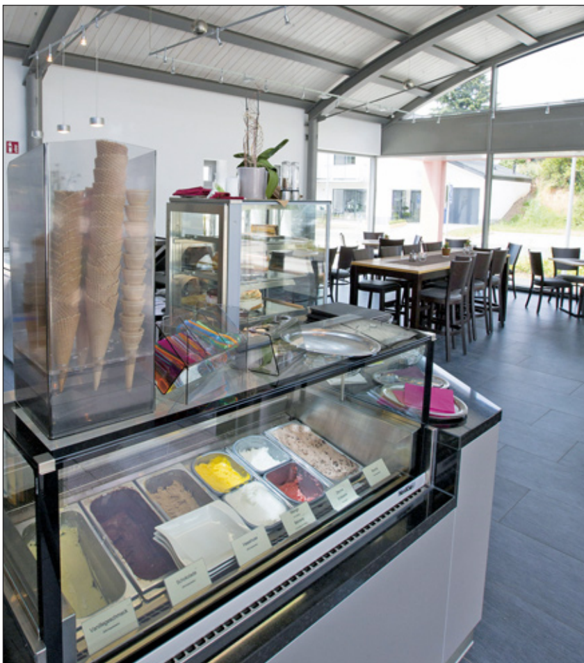
Auch Eis ist im Angebot: Blick in das Bistro-Café Stellwerk.

Das stellt an die Männer und Frauen durchaus besondere Herausforderungen: Wer im Gastrobereich arbeiten möchte, muss flexibel sein, selbstständig zur Arbeit kommen können, bereit sein, auch abends und am Wochenende zu arbeiten und Freude haben am Umgang mit den Gästen. rik