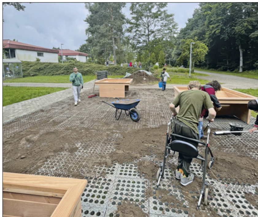
Von Schülern selbst angelegt: Der rollstuhlgerechte Schulgarten.