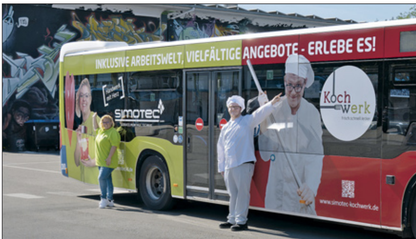
Mehr als ein Transportmittel: Der Stadtbus mit der Simotec-Werbung fährt im Kreis Kaiserslautern.

Kaiserslautern. Die Simotec GmbH freut sich, dass sie ab sofort mit einem eigenen Stadtbus im Kreis Kaiserslautern unterwegs ist. In Zusammenarbeit mit den Stadtwerken Kaiserslautern haben sie einen Bus in ihren typischen Farben Rot und Grün bekleben lassen, der nun ihre Botschaft in die Welt trägt.