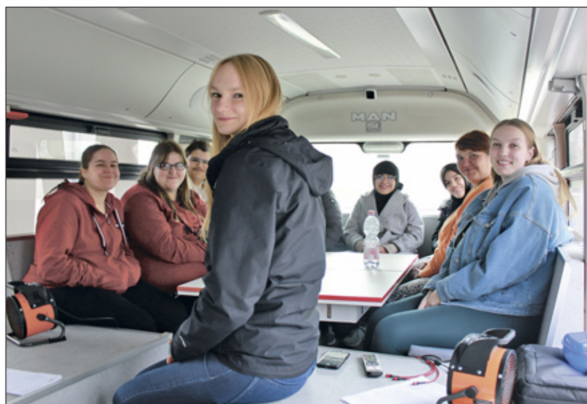
Interessierte konnten sich im Bus zu Themen wie „Apps installieren“ oder Datenschutz informieren.

Wie funktionieren eigentlich WhatsApp, Telegram oder Signal? Was tun, wenn ich meine Mails einfach nicht auf dem Smartphone finde? Wo ist die Datei hin, die ich doch gerade erst heruntergeladen habe? Wie klappt das am besten mit dem E-Paper der Lieblingszeitung? Wie finde ich die schnellste Bahn- oder Busverbindung über die RNV-App? Und wo bekomme ich diese App überhaupt her? Fragen, die sich viele Nutzer:innen von Handy, Smartphone und Computer, ob jung oder alt, ob mit oder ohne Behinderung, sicherlich häufig stellen. Und nicht immer liegt die Antwort direkt auf der Straße. Der „Medienbus“ schafft die Lösung und bringt Medienhilfe direkt zu den Menschen.