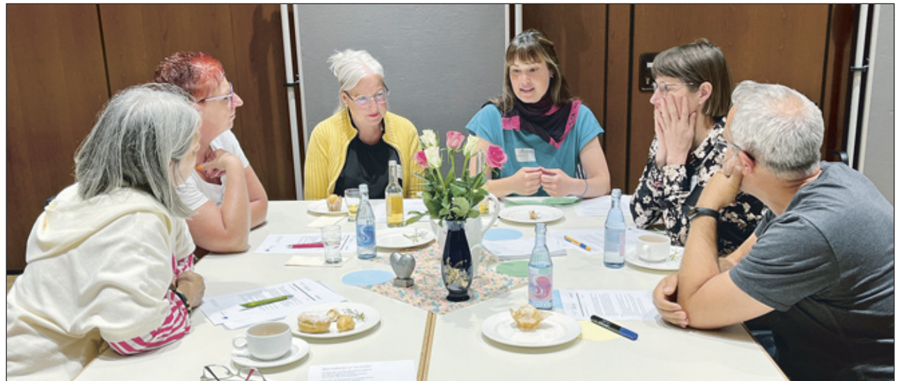
Wie kann künftig die Zusammenarbeit im Gemeinschaftswerk gestaltet werden: In bisher 13 Workshops haben sich Mitarbeiter:innen mit dieser Frage beschäftigt.

Die Reaktionen auf die geplante Kulturentwicklung sind vielfältig. Während einige Mitarbeiter:innen begeistert äußern: „Endlich tut sich was, prima dass wir mitgestalten können“, gibt es auch skeptische Stimmen: „Das wird ja eh nix, so wie früher sollte es wieder sein.“ Diese unterschiedlichen Meinungen spiegeln die Herausforderungen wider, die mit einem echten Veränderungsprozess einhergehen. Doch die Verantwortlichen sind optimistisch: „Es ist möglich, die Ziele gemeinsam zu erreichen!“