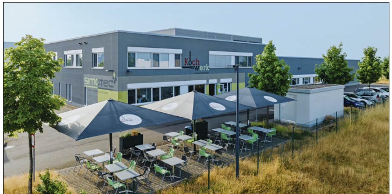
Arbeitsplatz für rund 80 Mitarbeitende, die täglich etwa 5000 Mahlzeiten zubereiten: Das Kochwerk.

Als Inklusionsbetrieb war der Anspruch des Unternehmens von Beginn an, soziale Verantwortung und wirtschaftlichen Erfolg miteinander zu verbinden. Egal ob Praktikum, Ausbildung oder sozialversicherungspflichtiger Arbeitsplatz, die Beschäftigungsmöglichkeiten sind vielfältig. Genau wie das Team, das aus Menschen mit und ohne Behinderungen besteht und heute rund 80 Mitarbeitende umfasst. Sie arbeiten Hand in Hand, um täglich rund 5000 Mahlzeiten für Kitas, Schulen und verschiede-